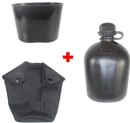
Foto 21- Cantil caneca e capa preta