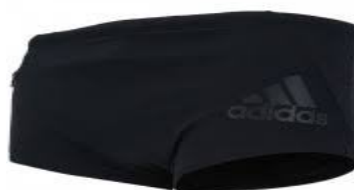
Foto 12 - Sunga masculina na cor preta.