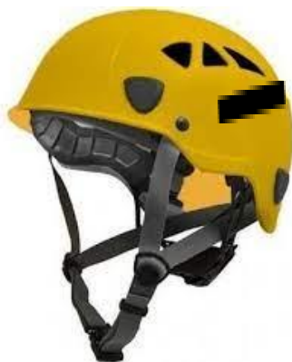
Foto 23 - Capacete de Resgate