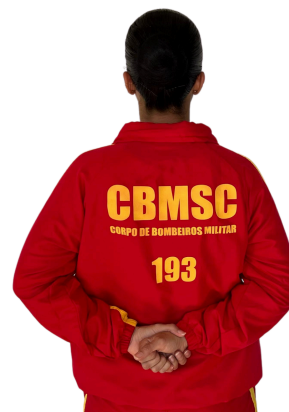
Foto 24 - Agasalho CBMSC