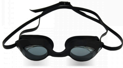
Foto 19 - Óculos para natação.