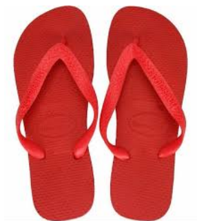
Foto - 09 Par de sandálias na cor vermelha.