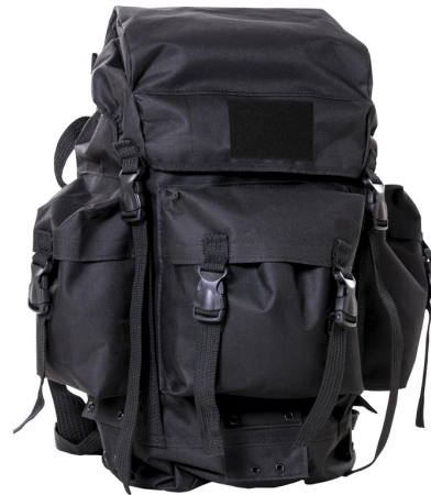
Foto 22 - Mochila cargueira 45 litros preta