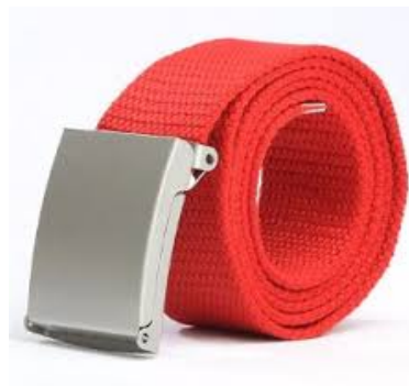
Foto 08 - Cinto lona vermelha com fivela metal prateada.