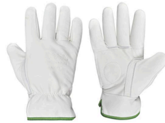
Foto 20 - Par de luvas de vaqueta.