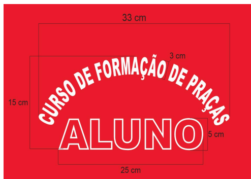
Foto 07 - Serigrafia para as costa das camisetas e moletom vermelho CFP Fonte das letras ARIAL BLACK .