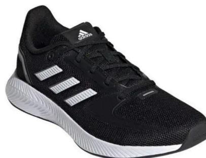
Foto 10 - Tênis para corrida.