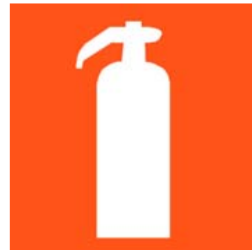
Figura 1 - pictograma indicativo de extintor de incêndio

§ 4º Nos casos em que os extintores colocados em suportes sobre o piso forem ocultados por balcões, mobiliário ou qualquer elemento deve ser prevista sinalização na parede complementar à do suporte.