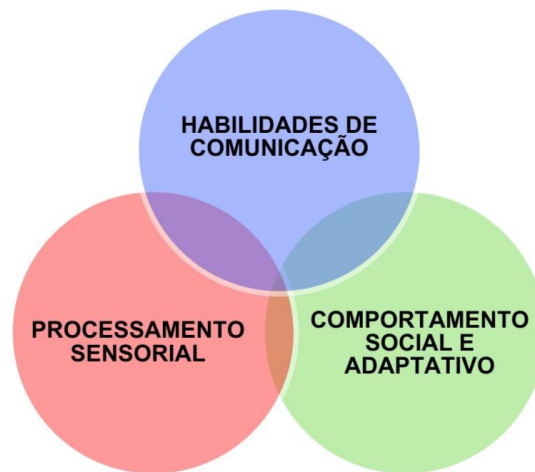
Figura 1: Representação esquemática das três grandes áreas do neurodesenvolvimento.

b) Essas três dimensões estão interconectadas. Compreender as características únicas de um indivíduo com TEA é o primeiro e mais crítico passo na prestação de serviços bem-sucedidos.