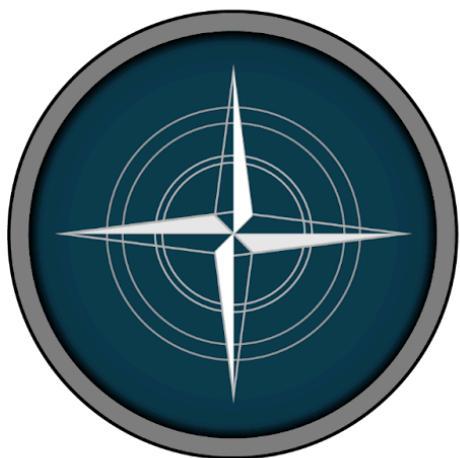
Rosa dos ventos Bússola