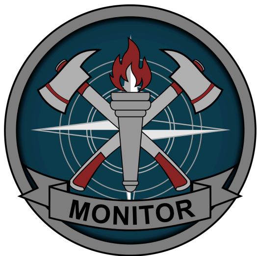
Digital - Impreso